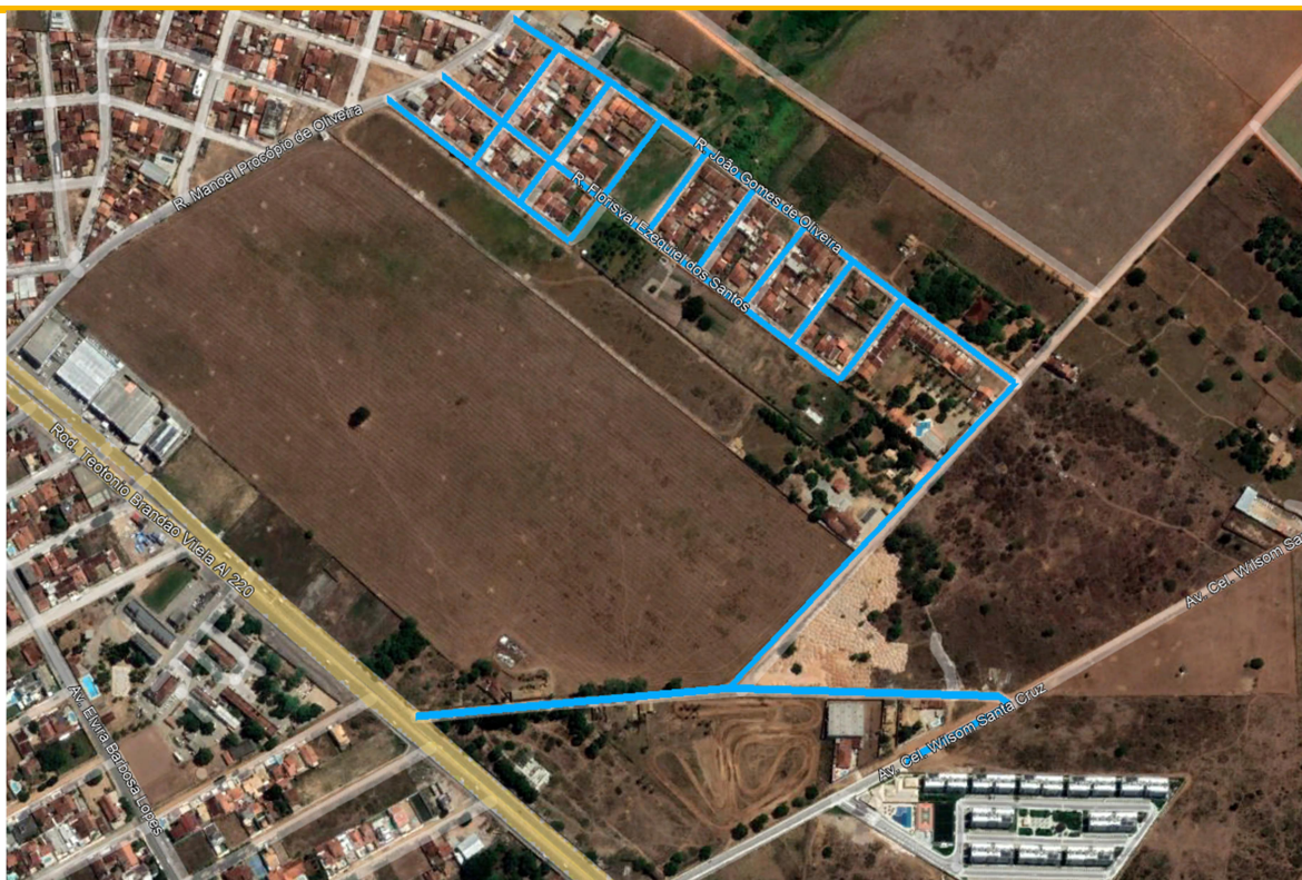
Figura 3 – Destaque das ruas a serem pavimentadas no Conjunto de Deputado Nezinho