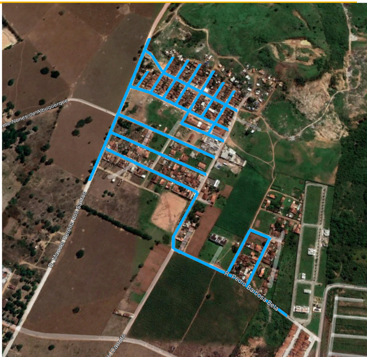
Figura 2 – Destaque das ruas a serem pavimentadas no Conjunto Mangabeiras