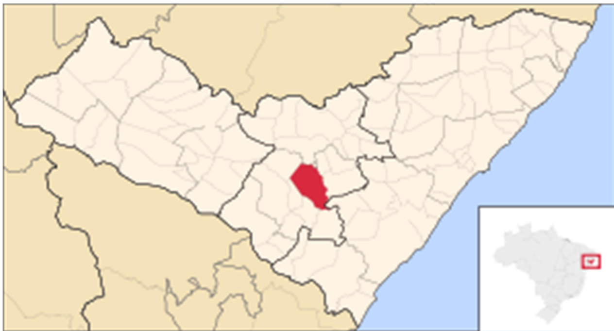
Figura 1 – Mapa de Alagoas com destaque de Arapiraca

Este memorial tem como objetivo descrever as principais atividades relativas à execução dos serviços que serão realizados na obra pavimentação de ruas do Conjunto Mangabeiras e Conjunto Deputado Nezinho.